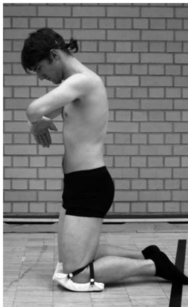
Abb. 7.5 Ausgangs- stellung Kyphotischer Kniestand.