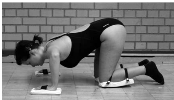
Abb. 7.3 Ausgangs- stellung Tiefer Vierfüßlerstand.