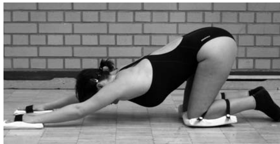
Abb. 7.2 Ausgangs- stellung Rutschstellung.